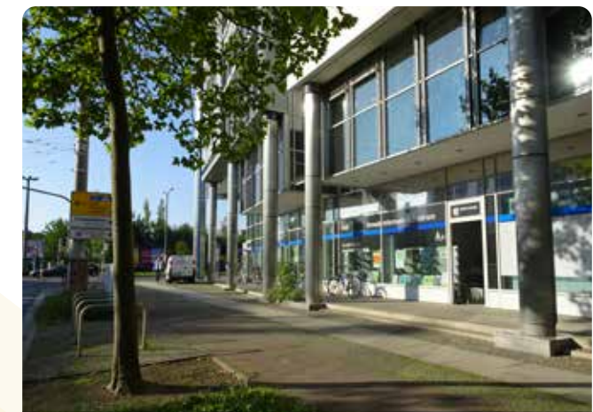
Das Umweltinformationszentrum in der Prager Straße