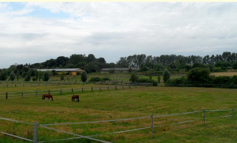
Pferdekoppeln bei Panitzsch