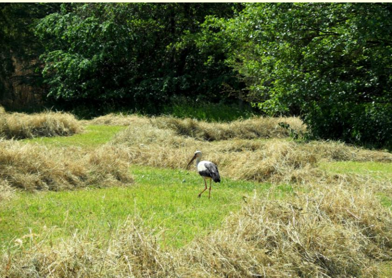
Heumahd auf den Plaußiger Wiesen

Zahlreiche Einzelflächen sind gesetzlich verankerte geschützte Biotope. Auf dem größten Teil der zusammenhängenden Grünlandflächen liegen Landschaftsschutzgebiete, sowie Flora-Fauna-Habitat-Schutzgebiete (FFH) von nationaler und internationaler Bedeutung. Ebenso dienen die Parthe-begleitenden Grünlandflächen dem Hochwasserschutz.