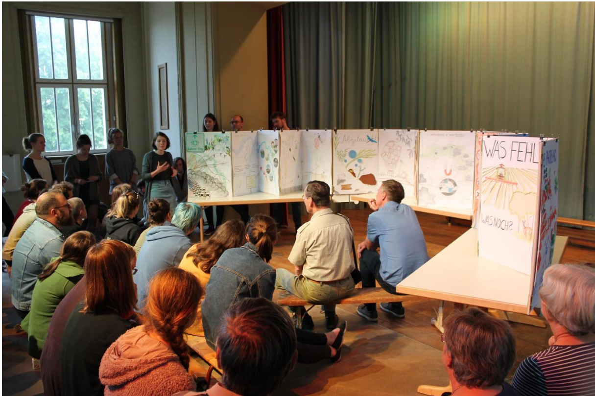
Präsentation des Leporellos in der Waldorfschule Leipzig.

Eine Arbeitsgruppe recherchierte in der Schulbibliothek und stieß dabei auf Landschaftsgedichte. Zur Präsentation trugen die Studenten je ein motivisch passendes Gedicht zu ihren Blättern vor. Die Gedichte machten plastisch, dass die Landschaft mehr als 200 Jahre lang ein zentrales Erfahrungs- und Kommunikationsmedium der Deutschen war – diese Zeit ist gegenwärtig leider vorbei.